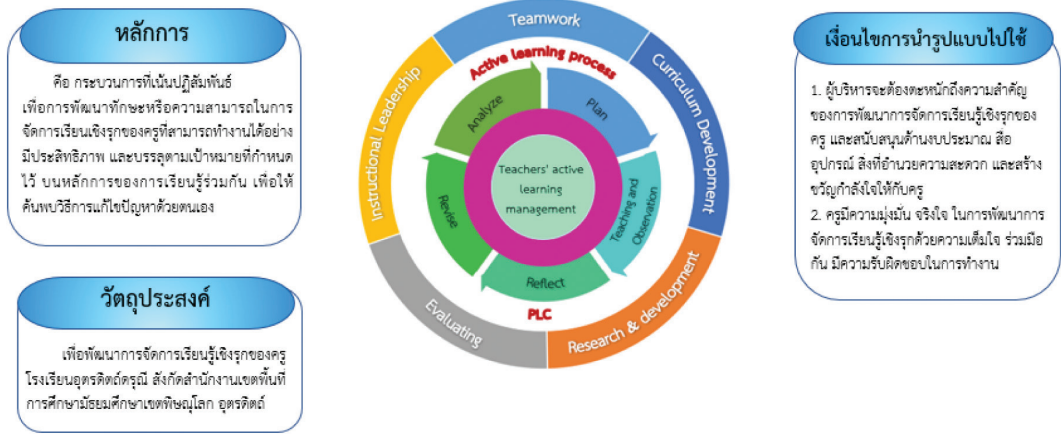
แผนภาพ 2 รูปแบบการบริหารงานวิชาการเพื่อพัฒนาการจัดการเรียนรู้เชิงรุกของครูโรงเรียนอุตรดิตถ์ครูมี

(1) หลักการ (2) วัตถุประสงค์ (3) องค์ประกอบของชุมชนแห่งการเรียนรู้ทางวิชาชีพครูโดยกระบวนการสร้างของการบริหารงานวิชาการ ได้แก่ องค์ประกอบที่ 1 ผู้บริหารและวิชาการ องค์ประกอบที่ 2 ทำงานเป็นทีม องค์ประกอบที่ 3 การพัฒนาหลักสูตรสถานศึกษา องค์ประกอบที่ 4 การวิจัยและพัฒนา องค์ประกอบที่ 5 การวัดผลและประเมินผล (4) กระบวนการเรียนรู้ 5 ขั้นตอน ได้แก่ ขั้นวิเคราะห์ (Analyze) ขั้นวางแผนการจัดการเรียนรู้ (Plan) ขั้นเปิดชั้นเรียนและการสังเกตชั้นเรียน (Teaching and Observation) ขั้นสะท้อนคิดเพื่อการพัฒนา (Reflect) และขั้นสรุปแก้ไขปรับปรุงและพัฒนาต่อเนื่อง (Revise) (5) เงื่อนไขความสำเร็จ คือ 1) ผู้บริหารจะต้องตระหนักถึงความสำคัญของการพัฒนาการจัดการเรียนรู้เชิงรุกของครู และสนับสนุนด้านงบประมาณ สื่อ อุปกรณ์ สิ่งอำนวยความสะดวก และสร้างขวัญกำลังใจให้กับครู 2) ครูมีความรู้ความเข้าใจการจัดการเรียนรู้เชิงรุก มีความมุ่งมั่น จริงใจ ในการพัฒนาการจัดการเรียนรู้เชิงรุกด้วยความเต็มใจ ร่วมมือกัน มีความรับผิดชอบในการทำงานโดยรูปแบบมีความเหมาะสมอยู่ในระดับมากที่สุด การขับเคลื่อนการบริหารงานวิชาการเพื่อพัฒนาการจัดการเรียนรู้เชิงรุกของครูอย่างเป็นระบบและต่อเนื่อง โดยมีเป้าหมายสูงสุดเพื่อพัฒนาความรู้ สมรรถนะและคุณลักษณะของผู้เรียน ส่งผลให้ครูมีความเข้าใจในหลักการของการบริหารงานวิชาการ ทักษะการจัดการเรียนการสอนเชิงรุกสามารถออกแบบและสร้างแผนการจัดการเรียนรู้เชิงรุกและนวัตกรรมการเรียนรู้ที่มีประสิทธิภาพ และทำวิจัยในชั้นเรียนเพื่อแก้ปัญหาผู้เรียนได้ และผู้เรียนมีพฤติกรรมการเรียนรู้ที่ดีขึ้น มีเจตคติเชิงบวกต่อการเรียนและมีความรู้ทั้งด้านวิชาการและทักษะชีวิต