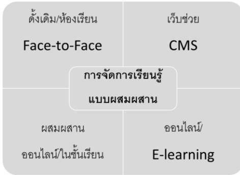
ภาพที่ 2 องค์ประกอบของการเรียนรู้แบบผสมผสาน

ให้ผู้เรียนช่วยกันตรวจงาน สามารถให้ผู้เรียนเทียบหลักสูตรกับสถาบันอุดมศึกษาชื่อดังหรือใช้อ้างอิงในการสมัครงาน