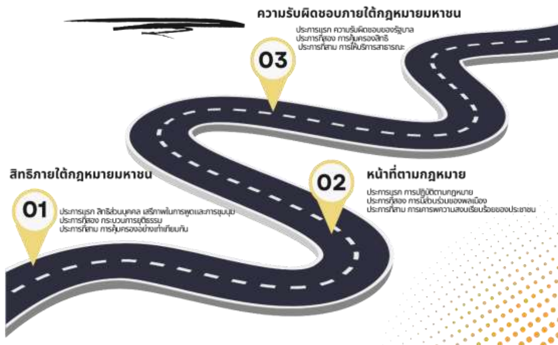
ภาพที่ 2 สิทธิ หน้าที่ และความรับผิดชอบ