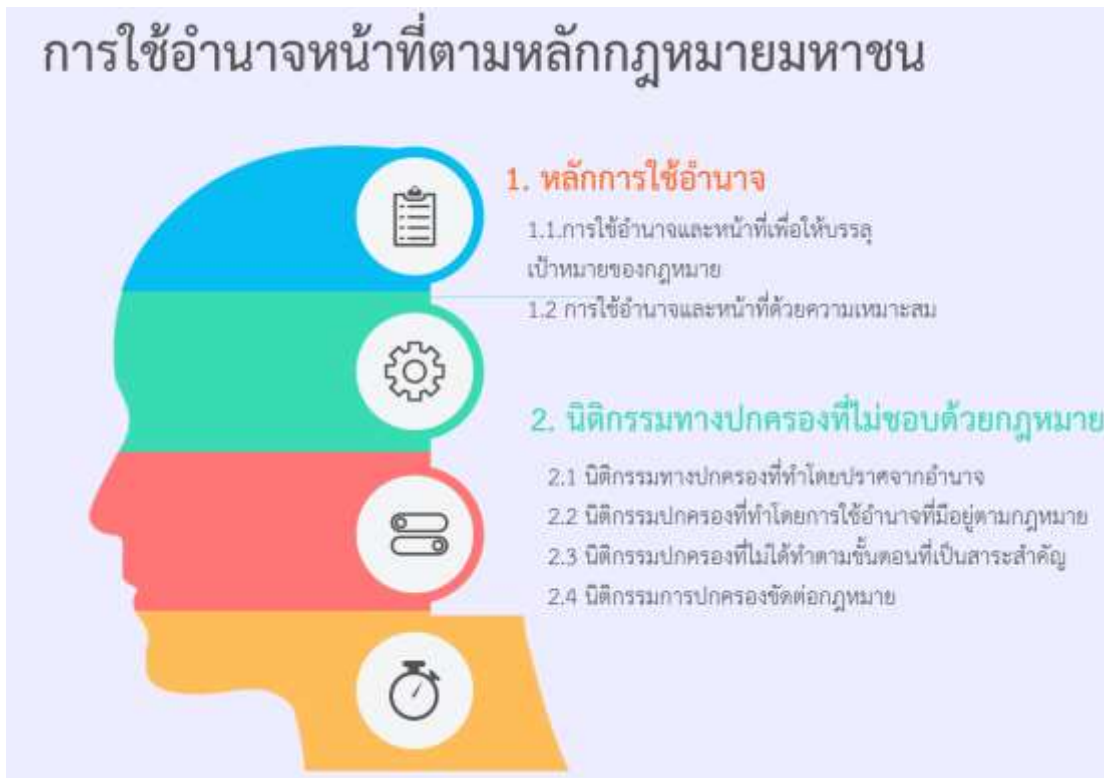
ภาพที่ 3 การใช้อำนาจหน้าที่ตามหลักกฎหมายมหาชน